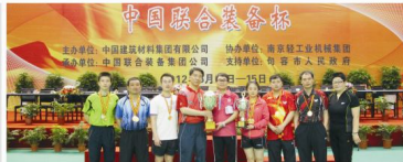
中国建材集团 第五届乒乓球比赛（中国联合装备杯）圆满落幕